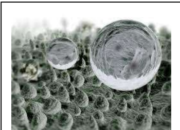
蓮葉表面有許多凸起

我們可以從電子顯微鏡下看到，蓮葉表面有奈米級的微小突起結構，可以讓水因為表面張力的作用形成水珠，並將水珠頂起，當蓮葉搖動時，水珠就能帶著髒汙滾離葉面。於是人類模仿蓮葉自潔的功能，生產出不怕髒汙的塗料。