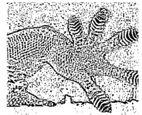
壁虎的趾腹有一片片的皮瓣

壁虎的腳趾趾腹有一片片的皮瓣，這些皮瓣是由數百萬根極細的剛毛構成，當剛毛和物體表面接觸時，就會產生很微弱的電磁引力，一根剛毛的引力能提起一隻螞蟥的重量，所以數百萬根剛毛理論上就能讓壁虎提起 40 公斤的重物。